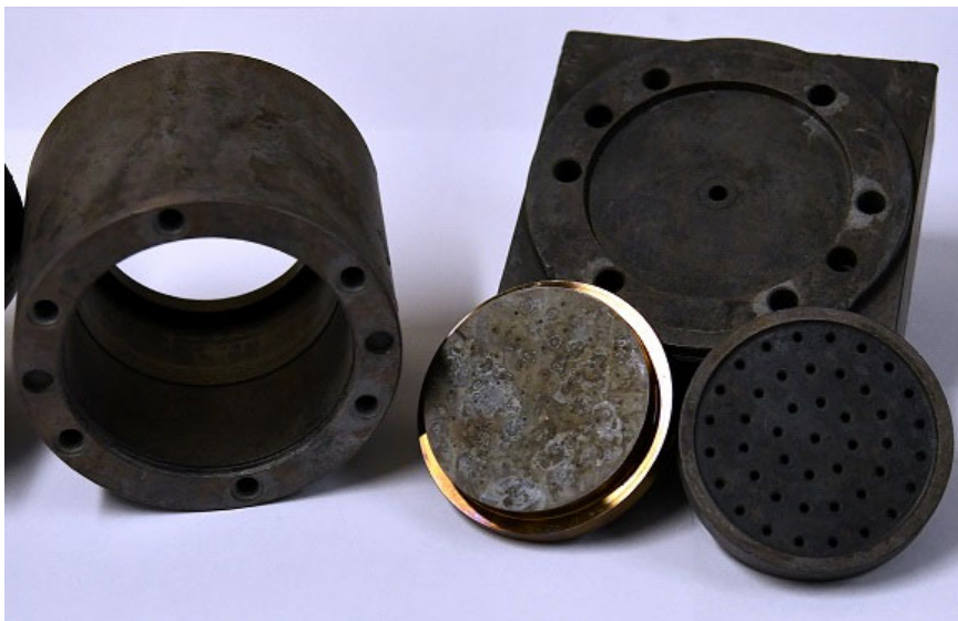
Partes de máquinas del Instituto de Tecnología Textil ITA después de la limpieza térmica

Download: https://drive.google.com/file/d/1InViseBfgqEFKes4FjKbcV6WJFuSoB4f/view?usp=sharing