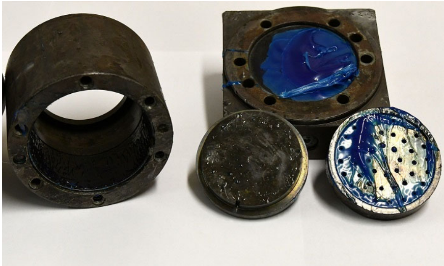
Partes de máquinas del Instituto de Tecnología Textil ITA antes de la limpieza térmica